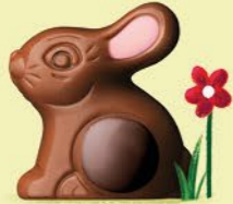
Praliné et riz soufflé