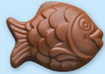
Chocolat au lait 36% de cacao

LA BOITE DE FRITURES EN CHOCOLAT ASSORTIES 220 G