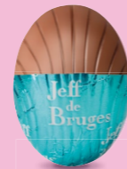
Ganache de chocolat noir au cacao d'Équateur

NOS POULES SONT ACCOMPAGNÉES D'UN ASSORTIMENT DE PETITS ŒUFS DE PÂQUES.