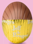
Praliné avec éclats d'amandes caramélisées et miel