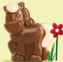
Moelleux au chocolat