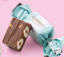
Chocolat au lait