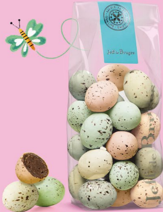
Praliné tendre ou praliné et éclats de crêpe dentelle