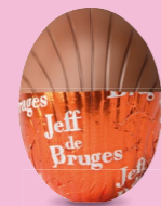
Suprême de chocolat au sucre pétillant