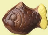
Praliné et noix de coco caramélisée