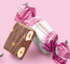
Framboise & meringue

POUR VOTRE SANTÉ, PRATIQUEZ UNE ACTIVITÉ PHYSIQUE RÉGULIÈRE. WWW.MANGERBOUGER.FR