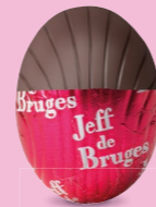
Praliné et éclats de noisettes caramélisées