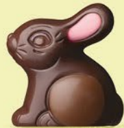
Praliné et éclats de noisettes caramélisées

NOS petits animaux en chocolat sont "presque" trop mignons pour être croqués !