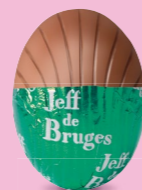
Praliné et éclats de crêpe dentelle