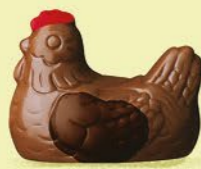
Duo praliné et ganache caramel