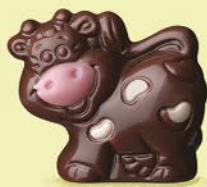
Praliné avec sucre pétillant