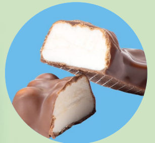
Un cœur tendre en guimauve enrobé de chocolat au lait