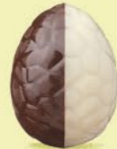
Praliné avec éclats de noisettes