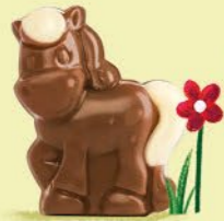
Moelleux au chocolat