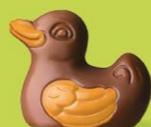
Praliné avec sucre pétillant