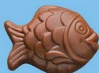
Chocolat au lait 36% de cacao