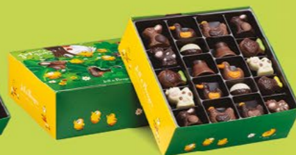
LE BALLOTIN DE 500 G NET 40 CHOCOLATS ASSORTIS