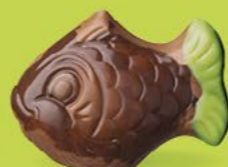
Praliné et noix de coco caramélisée