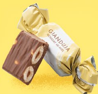
Nougat au miel

POUR VOTRE SANTÉ, PRATIQUEZ UNE ACTIVITÉ PHYSIQUE RÉGULIÈRE.