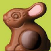
Praliné et riz soufflé