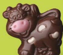
Praliné avec sucre pétillant