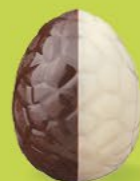
Praliné avec éclats de noisettes