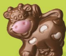
Praliné croustillant aux éclats de crêpe dentelle