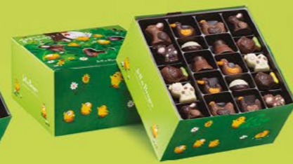
LE BALLOTIN DE 750 G NET 60 CHOCOLATS ASSORTIS