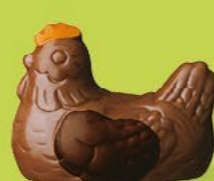
Duo praliné et ganache caramel