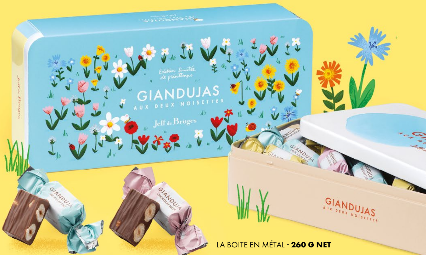
Chocolat au lait

Imaginez notre fameux gianduja dans lequel sont plongées non pas une mais deux noisettes entières. Voici l'alliance exquise du croquant et du fondant !