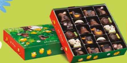
LE BALLOTIN DE 250 G NET 20 CHOCOLATS ASSORTIS