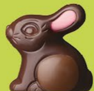
Praliné et éclats d'amandes caramélisées

Un lapin ou une poule, un canard ou un poisson, tout est permis quand on laisse libre cours à la gourmandise !