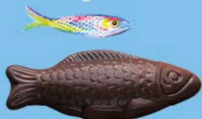
Chocolat noir 70% de cacao

LA BOITE DE FRITURES ASSORTIES - 220 G NET