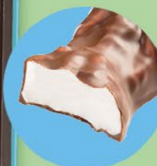
Un cœur tendre en guimauve enrobé de chocolat au lait

LA BOITE DE 28 LAPINS EN GUIMAUVE ENROBÉS DE CHOCOLAT AU LAIT** - 280 G NET